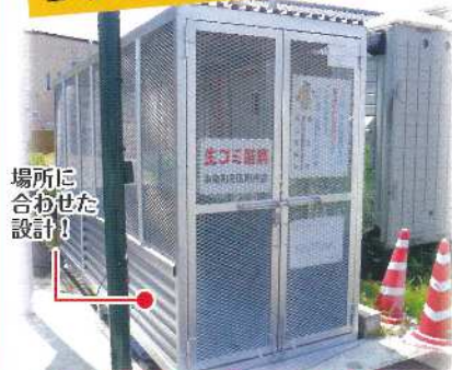
場所に合わせた設計!

固定ゴミステーションは、 お客様のご希望に応じて どんな形、大きさのものでも 製作可能です。